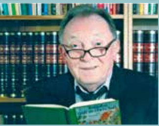
Peter Sodann, Buchladen