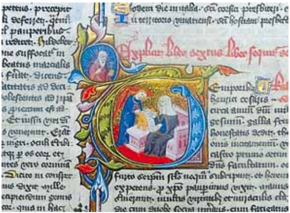
Sanctilogium, 15. Jh.: Initiale mit der heiligen Birgitta von Schweden (Badische Landesbibliothek)