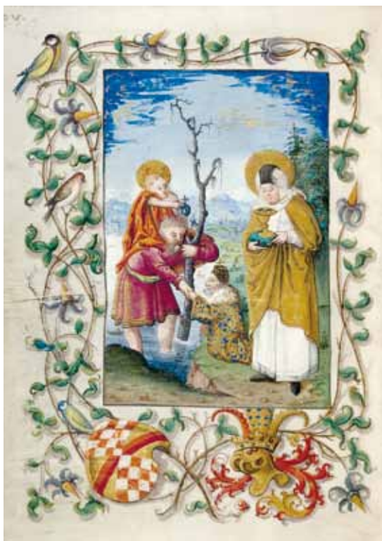
Stundenbuch des Markgrafen Christoph I. von Baden, um 1500 (Badische Landesbibliothek)