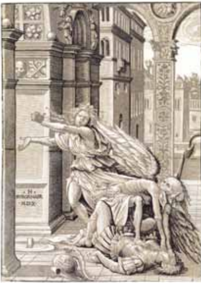
Hans Burgkmair (1473–1531): Der Tod überfällt ein Liebespaar, 1510 (Staatliche Kunsthalle Karlsruhe)