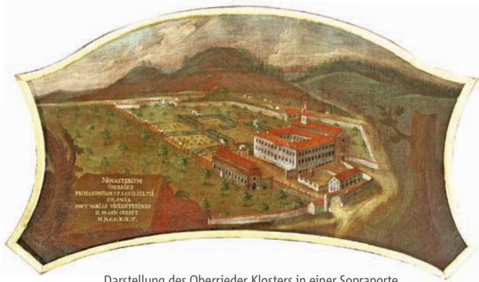
Darstellung des Oberrieder Klosters in einer Sopraporte aus dem Schloss Bürgeln (Mitte des 18. Jahrhunderts).